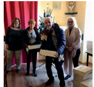
Retrait des colis à la mairie en présence de deux élus et de deux anciens

Pour les fêtes de fin d'année, la Mairie de Saint-Laurent-en-Royans a offert des colis aux Anciens du village. La distribution s'est faite en Mairie, ce qui a permis des échanges conviviaux. Les élus ont fait le choix de privilégier les agriculteurs de notre territoire, adhérents de l'Association des Producteurs Fermiers du Vercors.