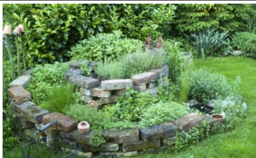
Une spirale aromatique permet l'implantation d'une très grande diversité de plantes aromatiques et médicinales.